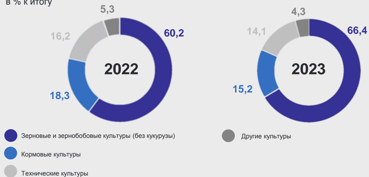
Структура внесения минеральных удобрений под сельскохозяйственные культуры в % к итогу